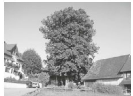
Dorflinde (Sommerlinde) von Deisendorf

Dort in der alten Mitte von Deisendorf startet unsere Wanderung durch den kleinen beschaulichen Ort, der – frei von Durchgangsverkehr - seinen dörflichen Charakter noch behalten hat. Deisendorf war einst ein wohlhabendes Dorf. Dafür sprechen schon alleine die beiden sehr reichen Grundherren, die Reichsstadt Überlingen und die Reichsabtei Salem, die sich den Ort links und rechts des sehr fisch- und mühlenreichen Riedbaches teilten. Die „Alte Poststraße“ in Deisendorf erinnert daran, dass der Ort sogar viele Jahrhunderte lang (1463-1867) eine eigenständige Poststation der Thurn- u. Taxis Postlinien Wien-Paris unterhielt.