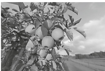
Herbstsonnenleuchten auf Äpfel

Der Herbst ist da und beschenkt uns mit vielen Früchten. Die sind alle gesund - besonders die Äpfel. Aber der Herbst selbst, ist der nicht eher ungesund? - Hier eine Antwort von ChatGPT ( https://chatgpt.ch/ ): „Der Herbst an sich ist nicht ungesund. Tatsächlich bringt die Jahreszeit viele positive Aspekte mit sich, wie frische Luft, bunte Blätter und die Möglichkeit, sich in der Natur zu bewegen. Allerdings können in dieser Zeit auch gesundheitliche Herausforderungen auftreten, wie zum Beispiel Erkältungen oder Allergien durch fallendes Laub. Es ist wichtig, auf die eigene Gesundheit zu achten, sich warm anzuziehen und auf eine ausgewogene Ernährung zu achten, um das Immunsystem zu stärken.“