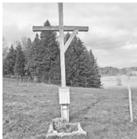
Mahnmal für die Hexenverbrennung in Wasserburger

Andererseits erlebte ausgerechnet die Hexenverfolgung während und nach den Bauernkriegen einen Höhepunkt. Die damaligen Ursachen, waren vor allem der Glaube an Hexerei und Dämonologie, aber auch soziale Unruhen und die - wie auch heute - damit eng verbundene Sündenbock-Suche. Allerdings führten auch das Aufkommen neuer (römisch-italienischer) Rechtsstrukturen und die mit den Grossmachtinteressen wachsende Gewalt zu Massenverfolgungen und Massenhinrichtungen von angeblichen Hexen. Schließlich fiel das Vermögen der ermordeten Witwen-Hexen an die Hexenrichter und ihrer Auftraggeber, die Fugger. Weiter geht es an unserem späteren Einkehr-Gasthaus "Hegestrund 3" vorbei durch die Wasserburger Bucht zum Wasserburger Malerwinkel (nicht zu verwechseln mit dem Langenargener und weiteren 10 Malerwinkeln am Bodensee). Von hier aus hat man nochmals einen tollen Blick auf die Halbinsel und die Berge im Hintergrund. Dann geht es mit sanfter Steigung weiter nach Hege. Dabei passieren wir das Mahnmal für die Hexenverbrennung in Wasserburg an der ehemaligen Richtstätte.