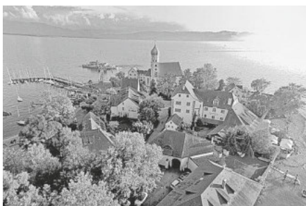
Halbinsel Wasserburg in stimmungsvollem Abendrot

Vom Bahnhof-Parkplatz aus gehen wir Richtung Süden an den See, passieren die Uferstraße und erreichen über einen schmalen Weg die Halbinsel (früher eine richtige Insel). Auf der Halbinsel sind besonders das Schloss, die St. Georg Kirche und das Malhaus interessant. Das Malhaus (heute ist das Malhaus ein sehr besuchenswertes Museum) war das ehemalige Gerichtsgebäude (Mal = alemannisch Gericht) der Fugger und Schauplatz der Wasserburger Hexenprozesse. Die meisten der Verurteilten fanden ihr Schicksal auf dem Richtplatz in Hege - wir treffen dort im Verlauf unserer Wanderung auf die Gedenkstätte.