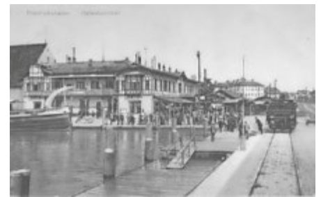
Hafenbahnhof in Friedrichshafen, hier um 1900