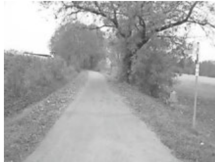
In Meisterhofen sind die Bahnspuren verschwunden, ab km 4,5 erkennt man sie aber deutlich

Es geht entlang der Rotach nach Meisterhofen, vorbei an der Blasiuskapelle weiter in Richtung Jettenhausen. Auf gut befestigten Wegen geht es nach Berg in die Talbahnstraße. Wir wandern noch ein kurzes Stück auf der Trasse der Teuringer-Talbahn in Richtung Holzhof.