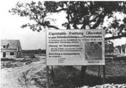
Bautafel am Eingang der Siedlung, Ecke Edelweissweg/Lilienstrasse.

Unsere Wanderung startet im Friedrichshafener Ortsteil Löwental, einem ehemals frei zwischen Wald und Wiesen gelegenen Reichskloster. Das Kloster Löwental war ein Kloster der Dominikanerinnen und wurde 1250 gegründet. Ursprünglich war das Kloster eine Burg des Reichministerialen Johannes von Ravensburg-Löwental und lag an der strategisch wichtigen Holzbrücke der Reichsstraße Ulm-Buchhorn über die Rotach. Nach der Säkularisation 1810 verfallen, bildete das Baugelände hier für Industrieanlage und für die Löwentalsiedlung mit die Grundlage für die Industrialisierung Friedrichshafens in den dreißiger Jahren. Vom dem ehemals großen Kloster findet sich heute nur noch ein Rest der alten Mauer. Zu finden ist dieser kurioserweise bei einem stadtbekannteren Laufbordell.